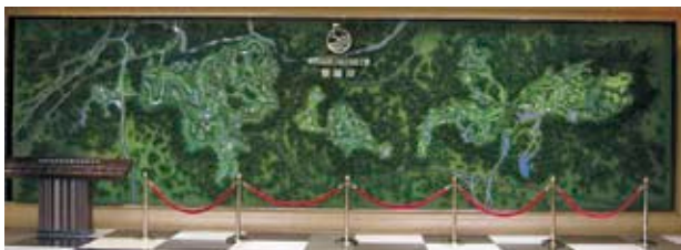
Modellen illustrerar Mission Hills Golf Club med sina tolv banor och övrig infrastruktur.

Det var precis på detta sätt jag upplevde dessa sex par femhålen. Man ville bara till nästa hål om det nu var ett par tre- eller par fyrahål. I min mening hade det räckt med tre till fyra par femhål i denna terräng som gick upp och ned mellan raviner och bergsmassiv. Det är obligatoriskt med golfbil och caddie för att hålla tempot på banan.